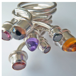
INGEBORG DE GROOT detail ringen: 7 Zonden