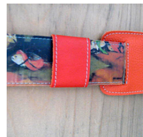
MIRJAM ZWOLSMAN detail tas: Zonder titel