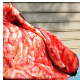
LIESBETH VAN WELL detail hoed: W'HATS' ON YOUR MIND?